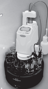
自動滴定システム